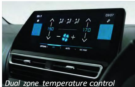
Dual zone temperature control