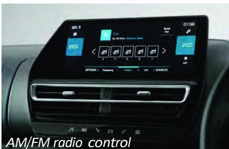
AM/FM radio control

Layar sentuh kapasitif berwarna hitam mengkilap dengan kualitas tinggi berukuran 25,4 cm yang responsif dan intuitif, memungkinkan akses mudah untuk menikmati fitur smartphone Anda dan tetap terhubung dengannya di jalan. Layar pintar ini juga menawarkan kontrol untuk sistem Dual Zone Temperature, input Kamera Belakang dan Peringatan Istirahat yang unik. Selain itu, ia mengontrol fitur Park Assist yang unik untuk parkir Paralel dan Tegak Lurus dengan kontrol Kemudi Otomatis.