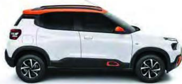
NEW CITROËN C3

Di sekitar kota atau di seluruh negeri, setiap Citroën memiliki DNA desain yang dinamis dan ramah lingkungan yang memberikan kenyamanan murni. DNA inilah yang diterjemahkan dengan sempurna melalui persembahan Citroën berupa hatchback dengan desain unik dan SUV kelas Comfort.