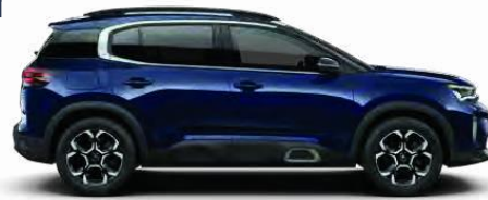
NEW CITROËN C5 AIRCROSS SUV