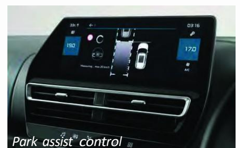
Park assist control