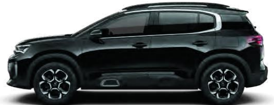
PEARL NERA BLACK